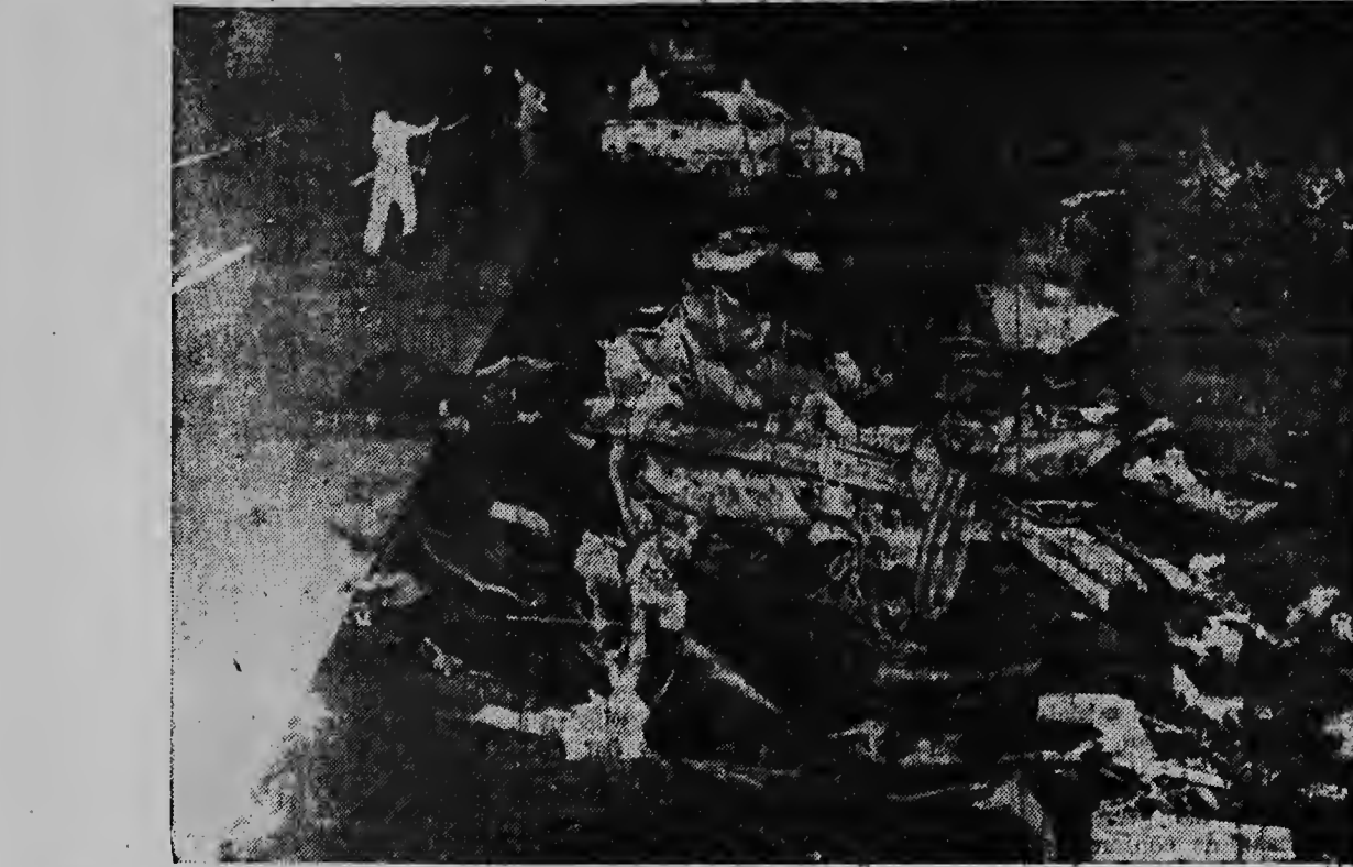
Esaki ta loke a sobra di un chake na Merca entre dos auto, seis hende a keda morto den e accidente...

Si bo kier tin bon probecho avisa den Arubaanse Courant